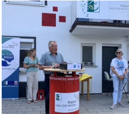
Vernissage am Bachtrompeter