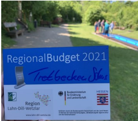
Regionalbudget am Tretbecken

Neuigkeiten aus der Region Lahn-Dill-Wetzlar