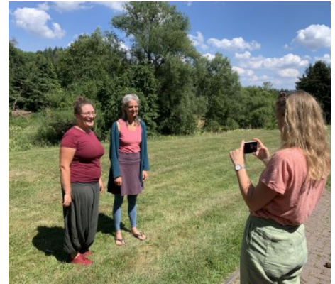
Interview am Waldhof