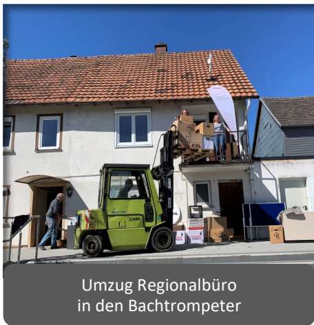
Umzug Regionalbüro in den Bachtrompeter