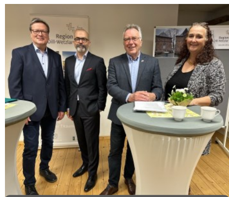
Übergabe LEADER -Förderbescheide