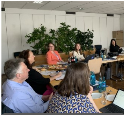
Sitzung Entscheidungsgremium 20.03.24