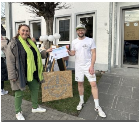
Eröffnung Brotkultur Hüttenberg