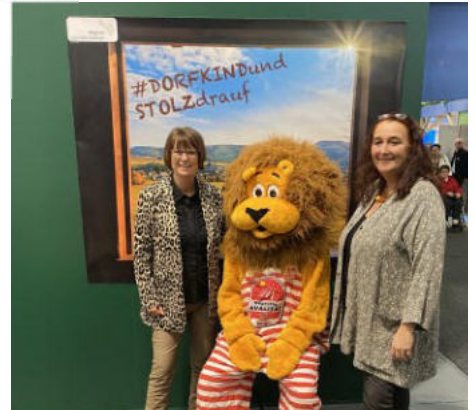
Instagram-Wand „Dorfkind und stolz drauf“