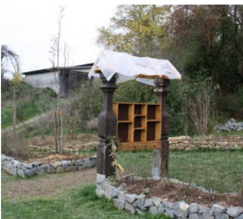
Insektenhotel im Natur-Gadde Schwalbach

Fördersumme aus dem Regionalbudget: 2.761 Euro