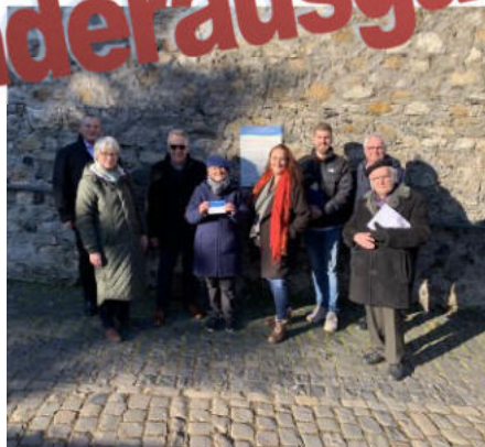
Hugenotten- und Waldenserpfad