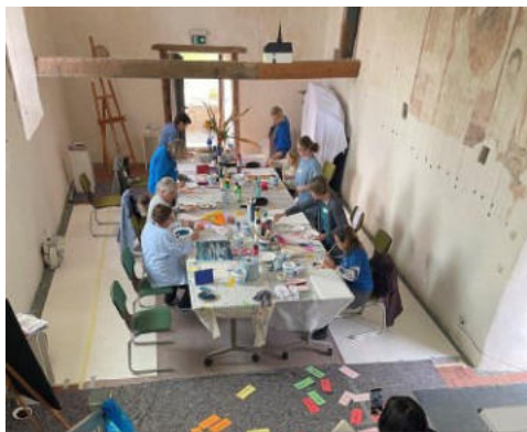
Workshop in der Atelierkirche Volpertshausen