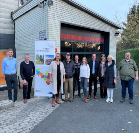
Vorstandssitzung bei der Feuerwehr

Region Lahn-Dill-Wetzlar im Fokus Deutschlands