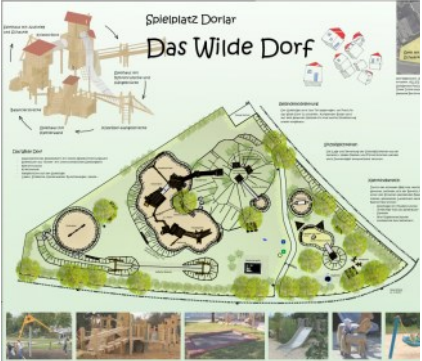
Spielplatz Wildes Dorf Dorlar

Fördermittel: ca. 31.000 € Gesamtinvestitionsvolumen: ca. 44.400 €