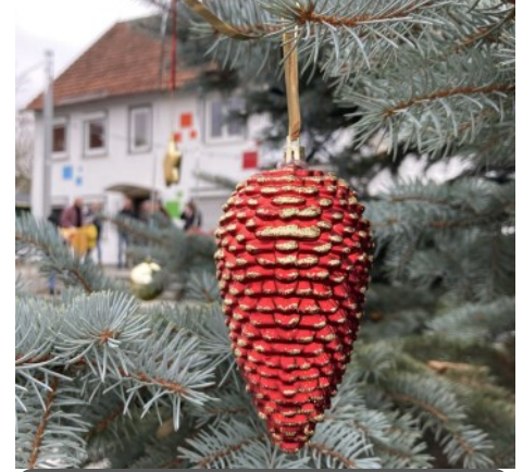
Weihnachten in der Region