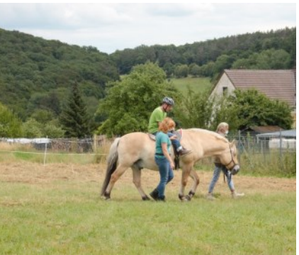
Therapeutisches Reiten Altenkirchen

Fördermittel: ca. 192.000 € Gesamtinvestitionsvolumen: ca. 280.000 €