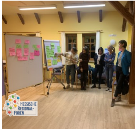
Hessische Regionalforen in Germerode