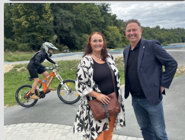
Pumptrack in Brandoberndorf Mit Bürgermeister Roland Hörster