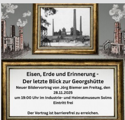
Flyer: Industrie- und Heimatmuseum

Weitere Informationen und Veranstaltungen finden Sie hier