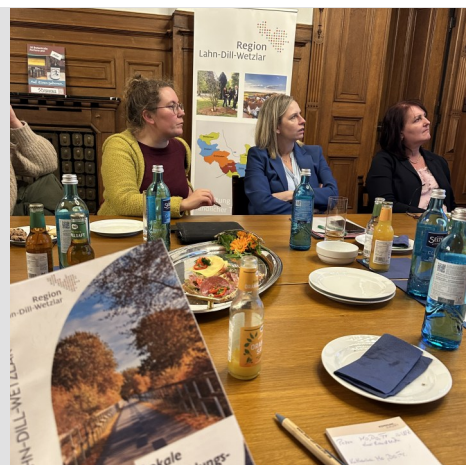
Zwischenevaluierung Region Lahn-Dill-Wetzlar

Vielen Dank an Saskia Kuhl, die die Räumlichkeiten zur Verfügung stellte.