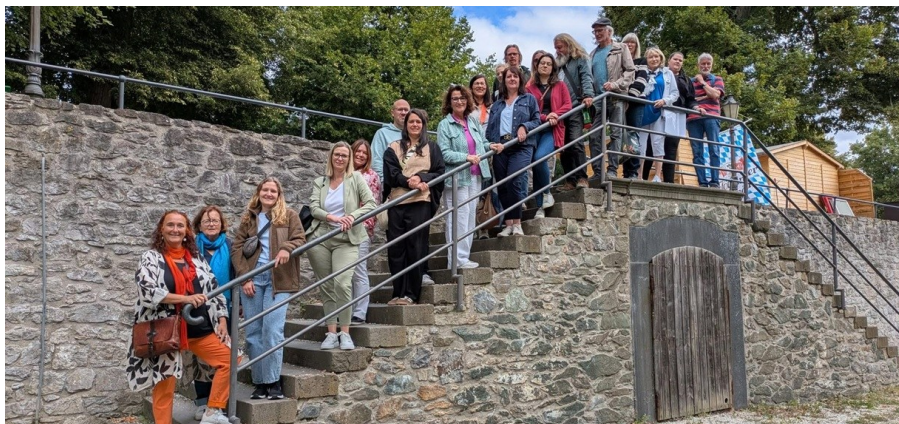
LEADER Entdeckertour im August 2025 durch den Süden der Region S.2