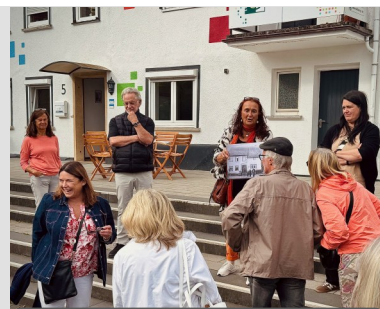
Ehrenamtscafé am Bachtrompeterplatz

Wir freuen uns schon auf das nächste Jahr, dann geht es nach Hüttenberg, Aßlar und Lahnu.