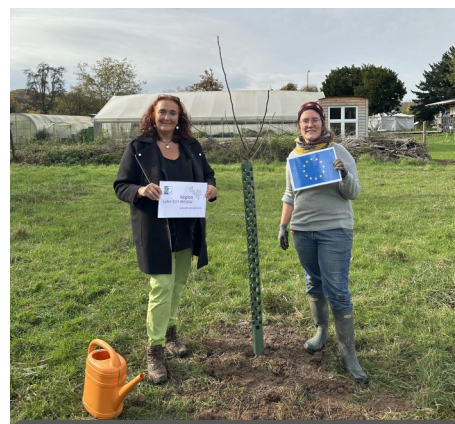
Baum-Challenge mit Heuchelheimer Schneepappel - Seite3