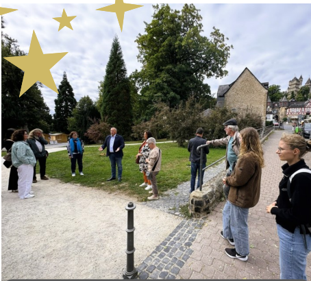
Kurpark Braunfels: Herrengarten und Mehrgenerationenspielplatz