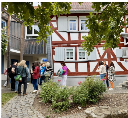
OASE der Dorfkümmerei Waldsolms auf der Entdeckertour