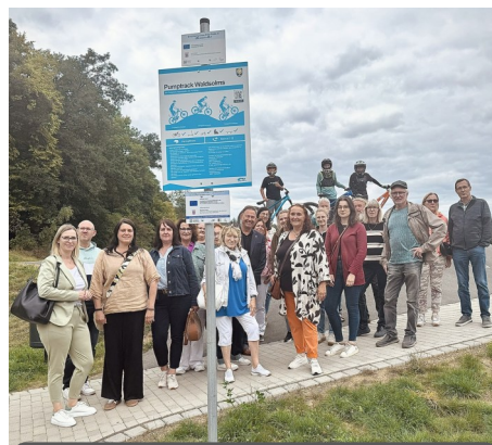
Pumptrack Waldsolms Auf der Entdeckertour